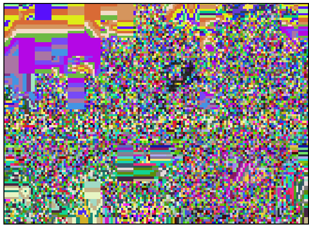
Franska arbetare vid Moulinex som ockuperat sin arbetsplats och hotar att spränga fabriken om de inte får de pengar de kräver i avgångsvederlag. Plakatet säger: Pengar eller pang!

Vårt självförtroende var på topp. Genom två viktiga delsegrar hade vi uppnått våra målsättningar och fått mersmak. Vad skulle vi göra härnäst? En sak var vi åtminstone säkra på - det skulle bli en tuff match.